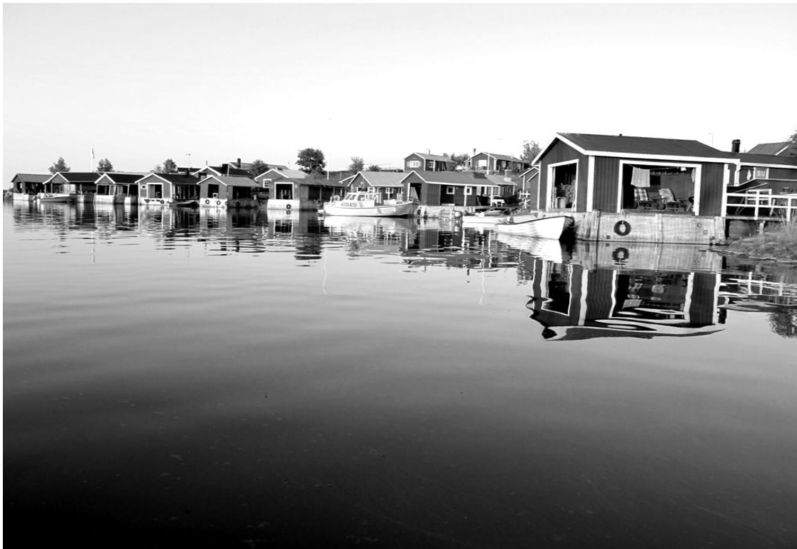
Bild 2: Fiskestugor på Brändöskär, Luleå skärgård Foto: Helena Holm, 2009

Norrbottens skärgård har sin unika karaktär som världens enda bräckvattenskärgård på grund av älvarnas sötvatten som rinner ut i havet. Skärgården har närheten till midnattssolen som gör sommaren ljus dygnet runt, de unika isvägarna som gör det möjligt att transportera sig med exempelvis bil på havsisen vintertid och många av öarna är bevarade med den karaktäristiska bilden av en skärgård. Genom Luleå kommuns många fritidsbåtägare tar kommunen platsen som en av Sveriges fritidsbåttätaste kommuner, med en fritidsbåt på var åttonde invånare. (Luleå kommun, 2012)