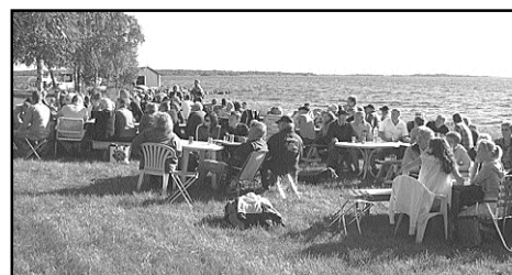
När föreningen fyllde 10 år blev det fest på Långön. 120 medlemmar plus några politiker och egen orkester och annat...