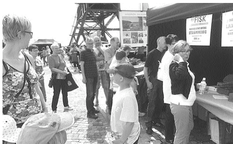
Deltagandet i skärgårdsdagen var en lyckad satsning med klirr i kassan.

Vår förening hade även deltagit i ett liknande arrangemang flera år tidigare.