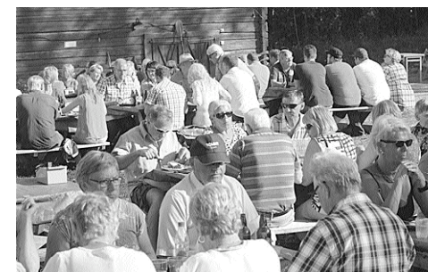
På Jopikgården på Hindersön har två fester hållits. Festligt. Folkrikt.