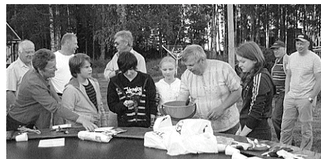
På Junkön har två sommarfester hållits