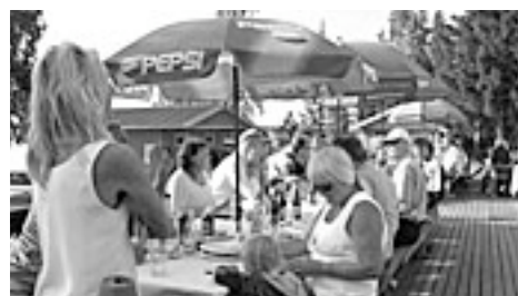
På Kallaxön fick vi låna båtklubbens fina anläggning