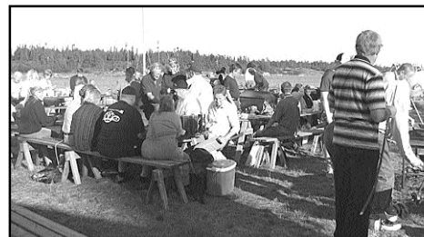
Den andra festen hölls i Kyrkviken och en senare i Skatamarksviken på Småskär (bild här). Här grillas det!