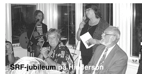
SRF-jubileum på Hindersön