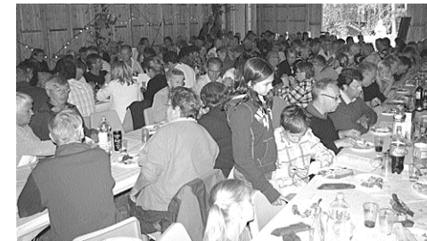
12 årsjubbe blev på Sandön, med 160 deltagare och ett lotteriprisbord av rang.