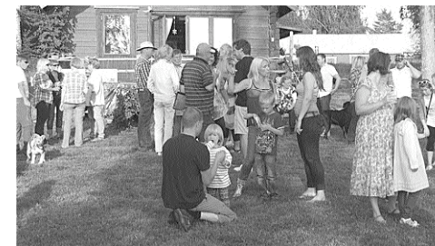
Sommarfesten på Degerön gynnades som vanligt av härligt väder.